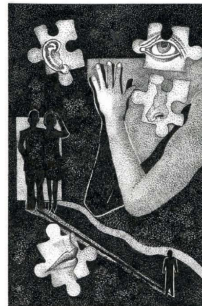
Odpri vse čute in počakaj.... Ilustracija, Edvard Kobal, 2019