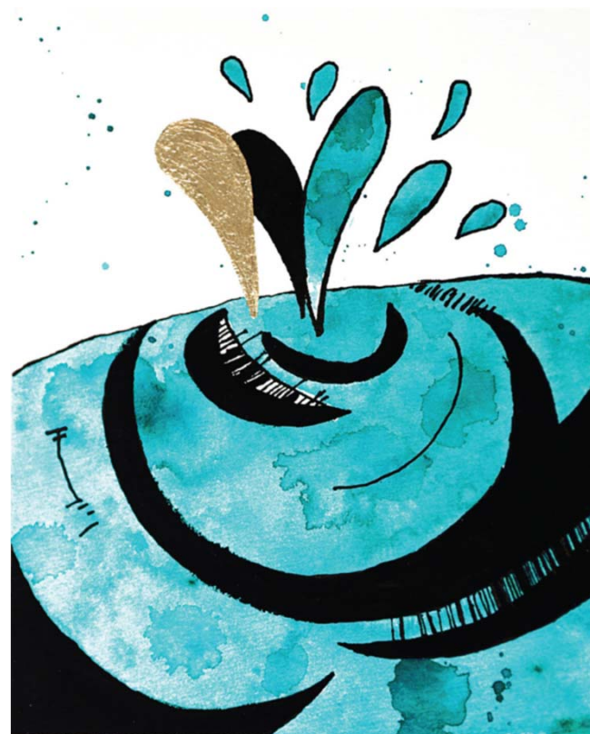
Iskanje pa odzvanja v svetu kalnega neznanja. Ilustracija: Tina Kobal, 2020

Nocoj želim si z vami deliti to, kar imam, in to, kar znam, to, kar lahko dam, da vam večer uravnam. Ne da bi izpustil, ne da bi izustil eno od misli, ki jih ne želite slišati, videti ali doživeti. Nocoj hlepim po spokojnosti, po sporočilu, ki vas je prešlo. Nocoj imate zadnjo priliko, da ga ujamete ob meni. Danes. Nocoj ali nikoli več. (P. Raspor)